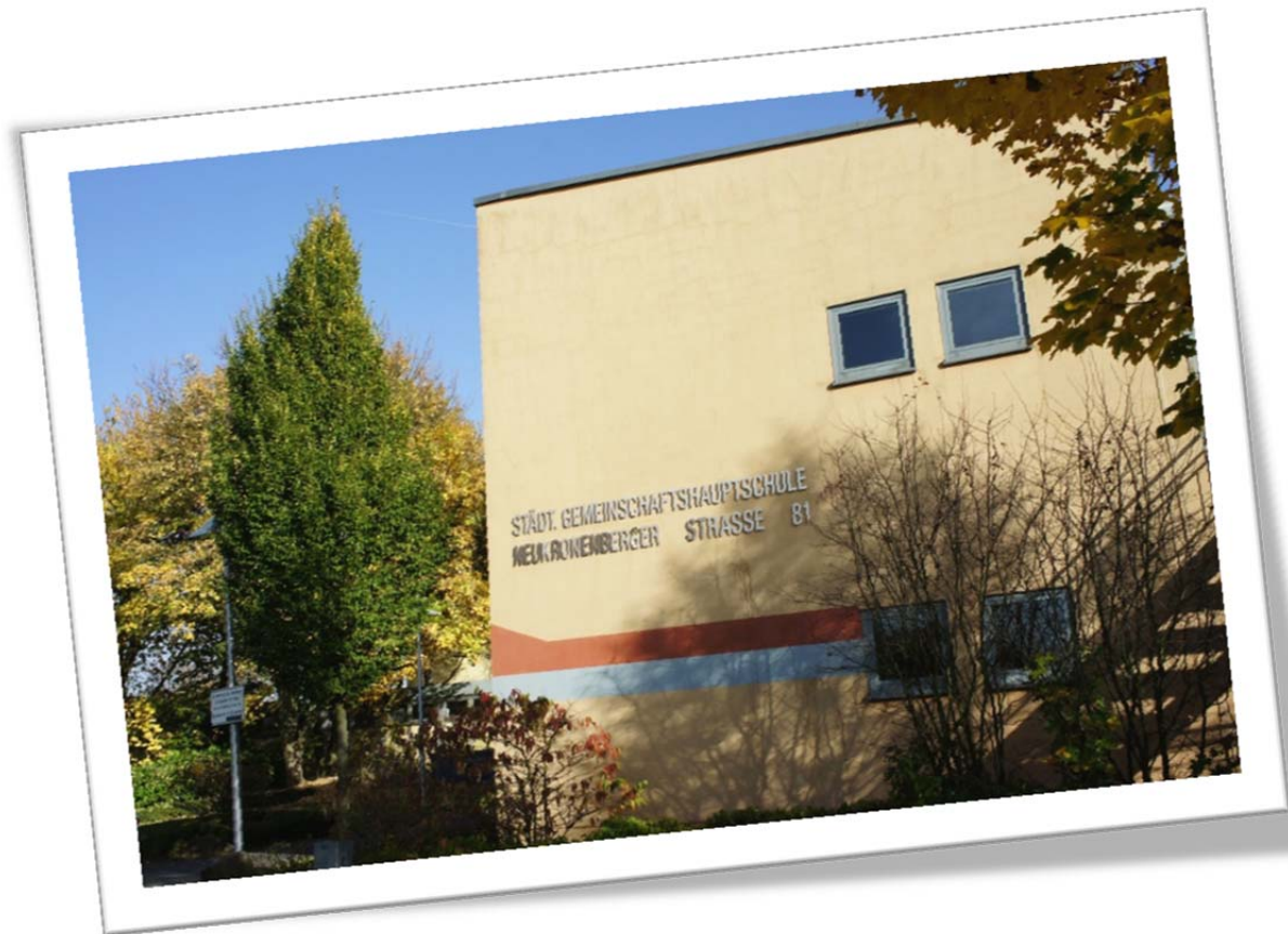
Ab 2015 die neue Sekundarschule am Schulstandort Neukronenberger Straße.